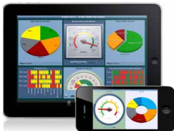
گرافها و سایر اطلاعات در iPad و iPhone نمایش داده می‌شوند.