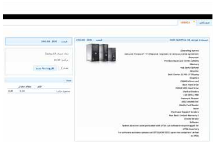
فروشگاه تحت وب - بخشی از پورتال کاربران POB